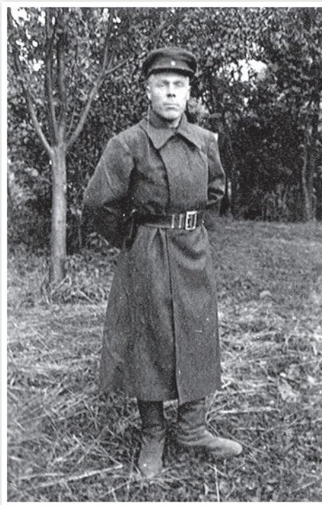
По-крестьянски тихий, немногословный, не дослужившийся до офицерских чинов и ярких наград, он казался несопоставимым с наставниками из училища...

Уход на пенсию подломил отца как пружину в механизме. Ни разу не бравший отпусков, не бывавший в санаториях, не видевший после войны ничего, кроме каждодневного труда, он враз оставался за бортом. Когда младший из нашей шестёрки, как и все остальные, поступил в вуз и освоился в учёбе, отец при очередной встрече заявил: «Я вас вырастил, я вас выучил, теперь могу отдохнуть». Пережитое не давало покоя, слабило зрение, барахлил «мотор». Газеты постепенно уступили место телевизору. Передачи о войне он не смотрел.