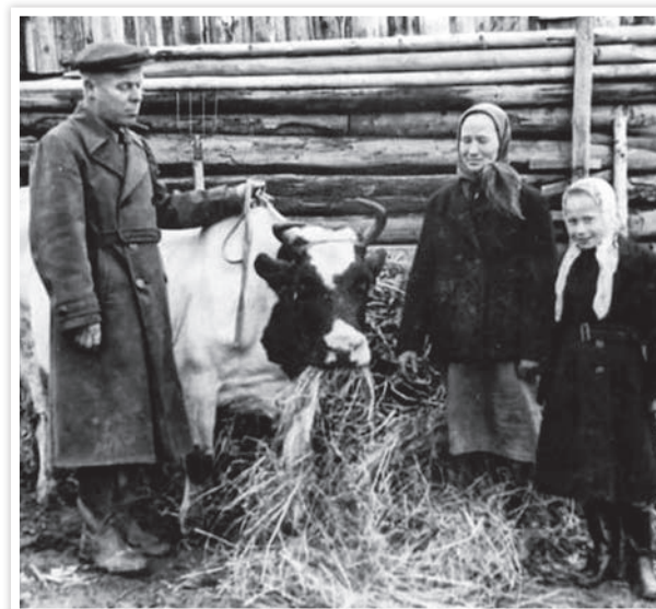
Перед тем, как отдать Зойку на мясокомбинат, отец вызвал фотографа. Так появилась семейная фотография, на которой исхудавшая кормилица стоит в огороде и смотрит в объектив печальными, всё понимающими глазами.

Проблема Зойкиной старости мучила отца. Перед тем, как отдать её на мясокомбинат, он вызвал фотографа. Так появилась семейная фотография, на которой исхудавшая, ослабевшая кормилица стоит в огороде, окружённая ребятами, и смотрит в объектив огромными, печальными, всё понимающими глазами. После ухода Зойки мать взбунтовалась и отказалась держать живность. Отец не противился.